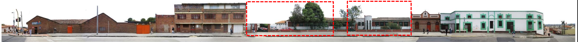
CARRERA 3 ESTE