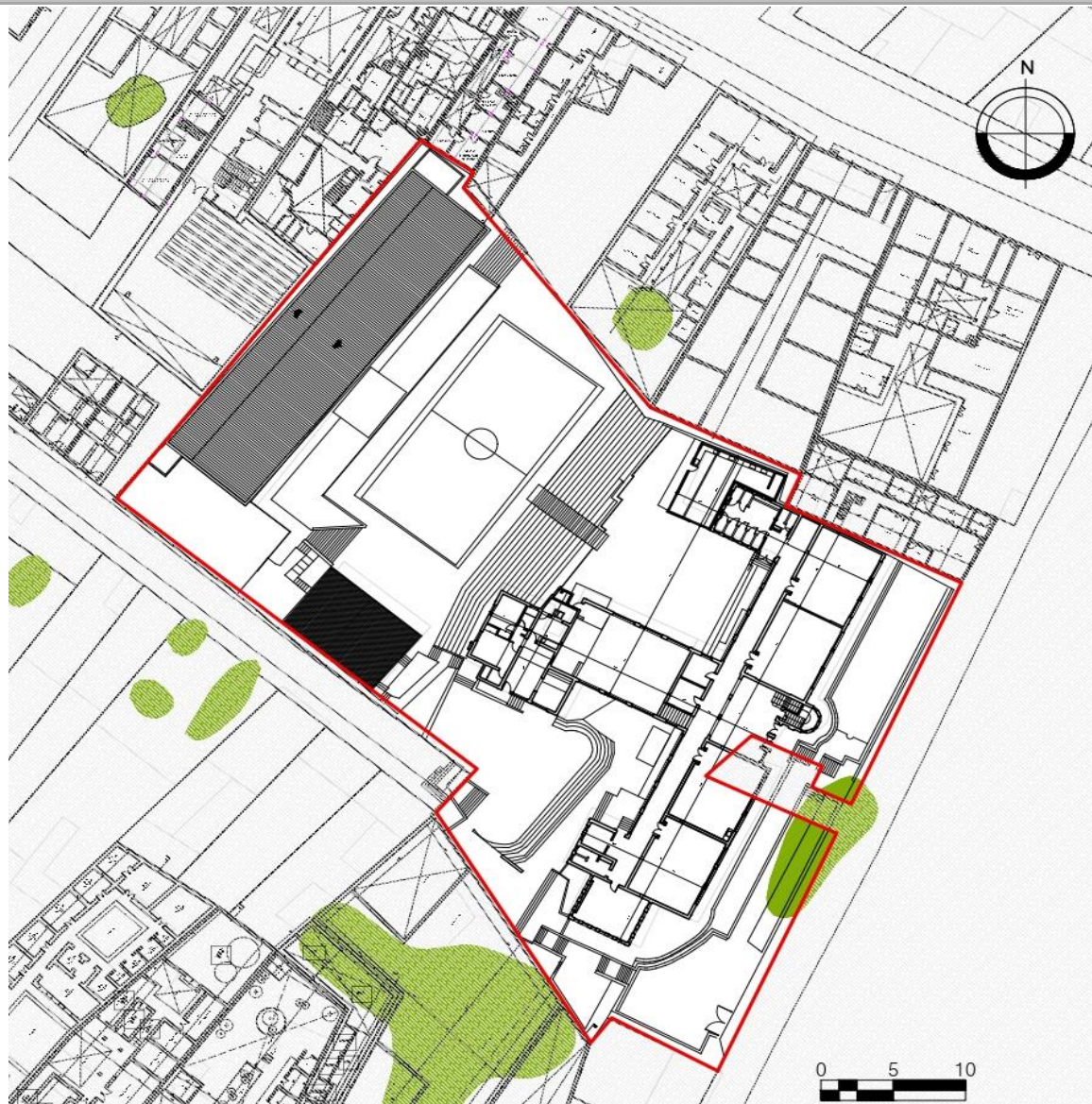
Planta primer piso